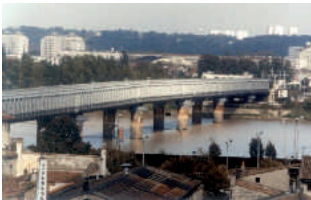
vue générale de l'ancienne passerelle Eiffel datant de 1860

* suivant classement du Moniteur du 29/6/7