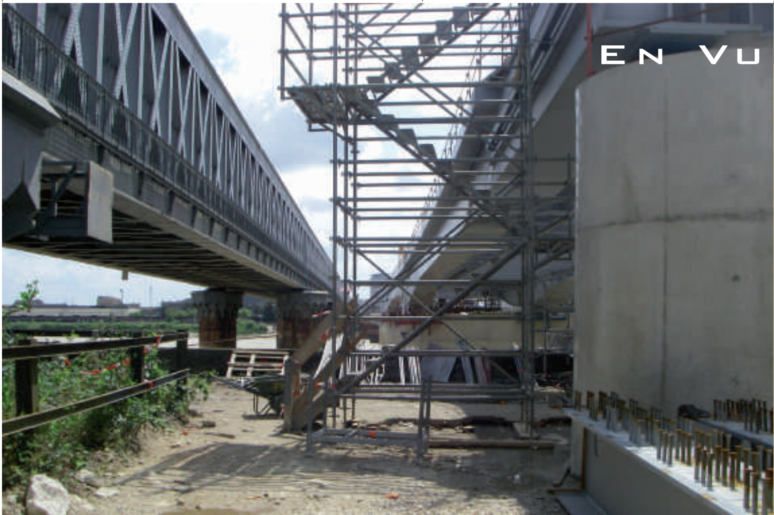
deux ponts, deux époques : à gauche, l'ancienne passerelle Eiffel de 1860 ; à droite, le nouveau pont en construction en 2007

des voies souterraines pour piétons, de supprimer les passages à niveau de Sainte Eulalie. L'ensemble, financé par Réseau Ferré de France (34%), l'Etat (22%), le Conseil Régional d'Aquitaine (18%), l'Europe (10%), la Communauté Urbaine de Bordeaux (9%) et le Conseil Général de la Gironde (7%) coûtera 300 M€.