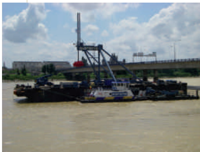
Le montage des tronçons s'effectue grâce à une chèvre géante de capacité levage 650 tonnes de la société Sarens. Un palonnier spécifique permet l'accrochage de toutes les poutres pourtant différentes, grâce à son système très sophistiqué qui se décale en fonction des dimensions de la poutre.