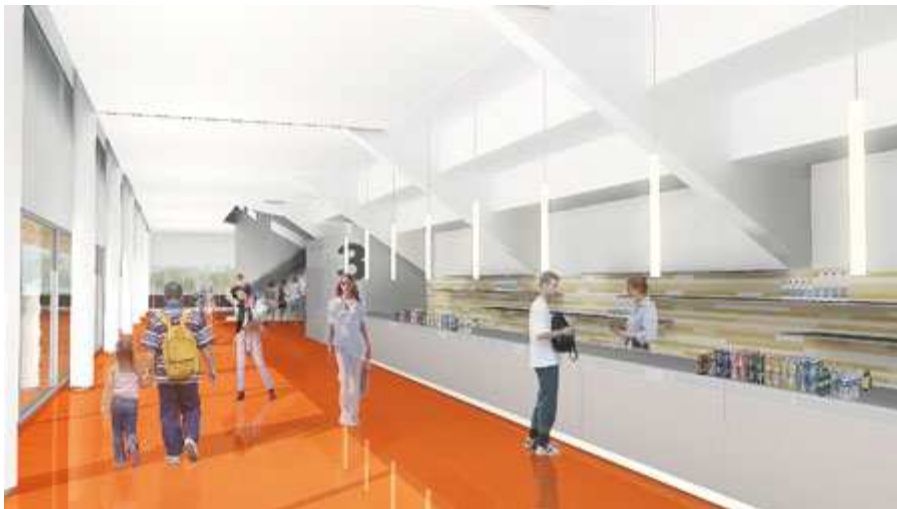
La salle sportive modulable