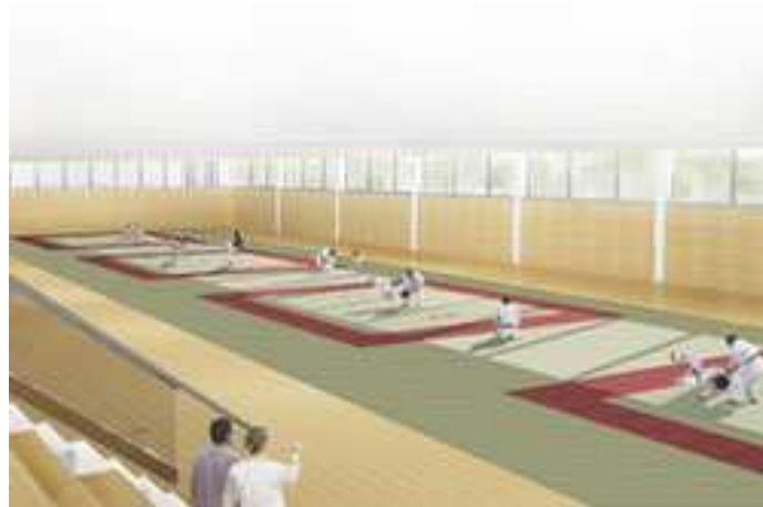
Le dojo départemental

La salle du dojo est accessible depuis le hall d'entrée puisque le dojo est situé en contrebas de l'accueil, de plain-pied avec le niveau extérieur.