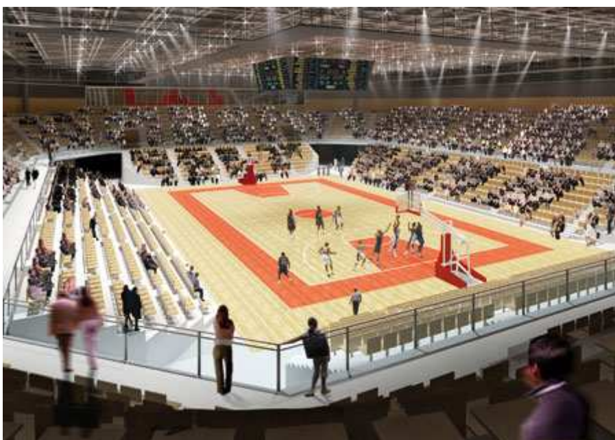
La grande salle

Cette salle a été conçue de telle sorte que sa capacité d'accueil du public soit modulable. 1 700 fauteuils en tribunes rétractables compléteront 2 500 sièges fixes et permettront ainsi à 4 200 personnes d'assister à de grands moments de spectacle depuis des gradins surplombant l'aire de jeu ou la scène.